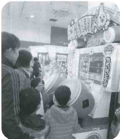
今年もご招待頂きました。