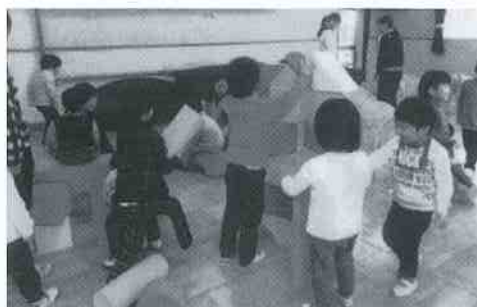
茨城県社会福祉事業協力会様