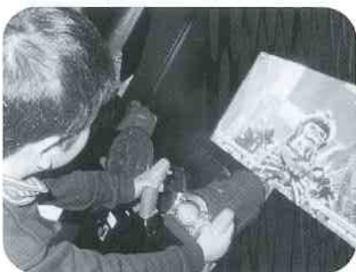
ピンクパンサー様