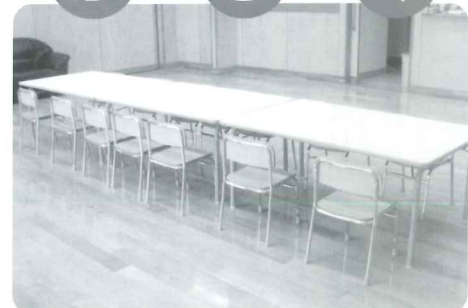
幡谷 祐一 様 一仙 友 イス、テーブル