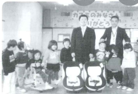
カスミュニオン 様 チャイルドシート