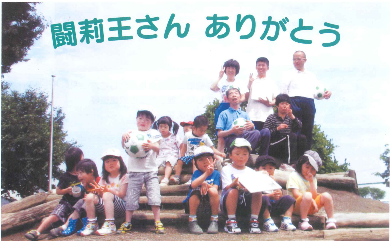
いただいたサッカーボールと色紙、大切にします。

育心園 〒310-0841 水戸市酒門町4280-2 Tel : 029-247-5151 Fax : 029-248-5720