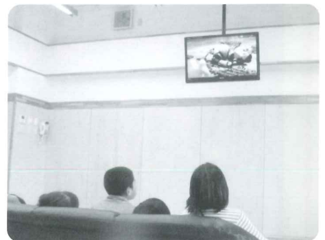
会 様 — 幡 谷 定 俊 様 マイクロバス、DVD