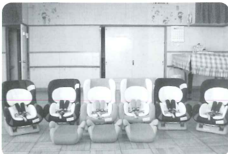
NHK歳末たすけあい義援会 様 チャイルドシート